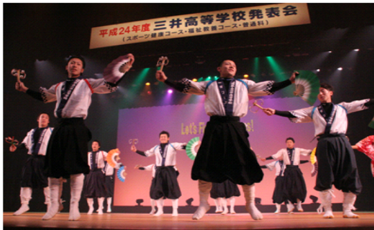
(三井高発表会での御神楽)

同時に、その基礎となる確かな学力の育成を重視し、基礎的・基本的な学習内容について徹底して指導しています。